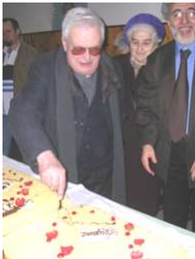
50°e 25° di don Franco